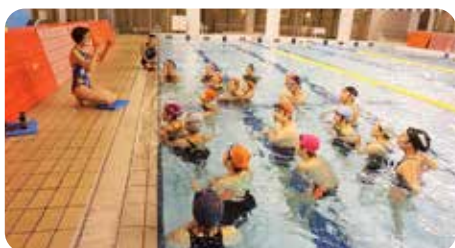
先生の説明を真剣に聞いています