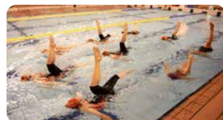
12/26の発表会頑張りました