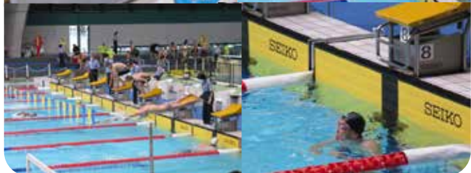
大会の様子(会場:辰巳国際水泳場)