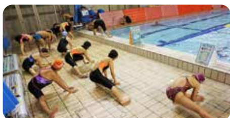
準備体操は念入りに行います

12月26日の20年最後のレッスンでは、約3か月間で覚えた演技(曲:ちびまる子ちゃん)の発表を2チームに分かれて行い、これまでの練習の成果を確かめ合いました。(ホームページにも掲載中)